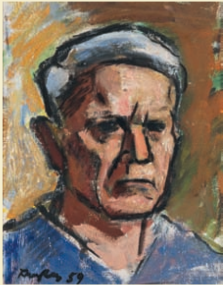
Abb. links: Selbstbildnis, 1959, Öl auf Leinwand