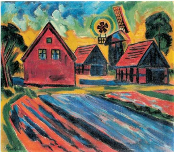
Hermann Max Pechstein, Rote Häuser mit Windmühle, um 1922, Öl auf Leinwand

Republik versinkt in dem Missbrauch der Künste zur Legimitation der Verfolgung politischer Gegner und „rassistisch Minderwertiger“. Nach 1945 entwickelte sich Deutschland zu einer stabilen Demokratie. Mit der Hypothek der Vergangenheit belastet, musste sich die Kunstszene nach Kriegsende geradezu zwangsläufig neu orientieren und neu erfinden. Die dezidierte Abkehr von der Figuration bestimmte nunmehr das Geschehen auf dem Kunstmarkt. Die Künstler, die sich trotz veränderter Vorzeichen nicht der Abstraktion und dem Informell öffneten, schwammen gegen den Strom der Zeit und riskierten das Abseits. Die künstlerische Auseinandersetzung mit der Landschaftsmalerei, dem Interieur und dem Stilleben zeugt auch in Zeiten der Bedrängnis nicht nur von dem Veränderungswillen der Künstler, sondern auch von der Sehnsucht nach einer intakten Welt. Nicht jede und nicht jeder hatte den Anspruch eines Weltveränderers. Manche folgten einfach ihrer künstlerischen Bestimmung, undogmatisch, unpolitisch, nur dem eigenen Künstlerdasein verpflichtet. Als weitere Station wird diese Präsentation im Kallmann-Museum in Ismaning zu sehen sein.