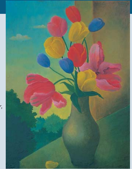
Abb. links: Conrad Felixmüller, Frühlingsabend in Klotzsche, 1926, Öl auf Leinwand